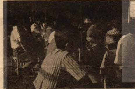
Mücadeleye kararlı Kimya-İş üyesi Kav işçileri.

sedasız, işçilerden habersiz sözleşme imzalayacağını ve alınterinin hakkı üzerinde yarılan bu iğrenç pazarlıkla -rınbu bozuk düzen değişmedikçe ortadan kalkmayacağını belirten Kimya-İş yöneticileri, Kav işçilerine mücadeleye devam edip etmeme konusunda ne düşündüklerini sordular. Kav işçilerinin cevabı kısa ve kesin oldu: "Biz inandık, Kimya-İş'in saflarında birlik olduk. Petrol-İş'in sağlayacağı üç kuruşluk menfaate kamayız. Kenetlendiğimiz saflarımızdan ayrılmayız. Örgütümüzü, birliğimizi, beraberliğimizi her türlü saldırıya karşı koruyacağımıza verilmiş sözümüz var. Bu mücadele burada bitmez."