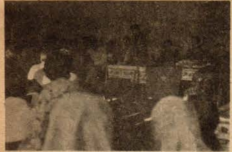
Kav işçileri sorunlarına çözüm arıyorlar.

Çalışma Müdürlüğü'nün Petrol-İş'in tarafını tuttuğunu bunun için yasaları çiğnemekten hiç çekinmediğini, hakiminde, usulsüz ve kamusuz davranarak görevini kötüye kullandığını belirttiler. Bunun üzerine Kav işçileri haklı olarak, "Biz yüzden fazla Kav işçisi burada Kimya-İş'le birlikte toplanmış bulunuyoruz. Nasıl olur da Petrol-İş üyesi olabiliriz? Çalışma Müdürü ve Hakim Z. Sirkecioğlu kime güveniyorlar? Hakkımızı göz göre göre nasıl yiyorlar?" diye sordular.